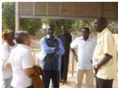
En compagnie des responsables de l'UFR Santé de Thiès et du RNL