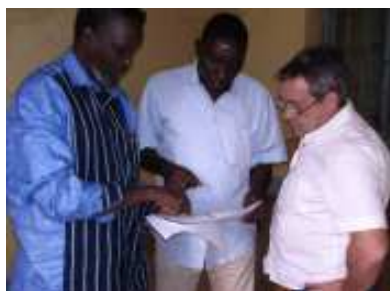
En discussions avec l'expert et le coordonnateur du RNL sur les plans de réhabilitation