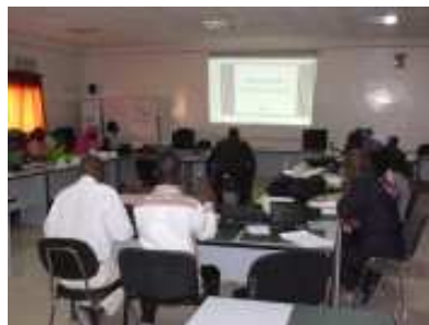
Vue des participants

La cérémonie de clôture a été présidée par le Docteur Boubacar Dankoko, Conseiller technique N°1 du Ministre de la Santé et de la Prévention.