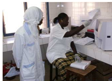
Superviseurs observant le personnel au travail

visités : 36 laboratoires de centres de santé et 16 laboratoires de niveau régional. Les superviseurs ont travaillé sur la paillasse avec les techniciens, depuis le prélèvement jusqu'au rendu des résultats d'analyses, observant, rectifiant si nécessaire, encourageant ou renforçant les acquis.