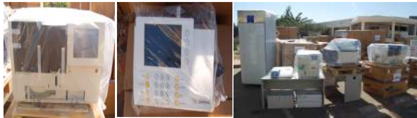
Une partie du matériel réceptionné