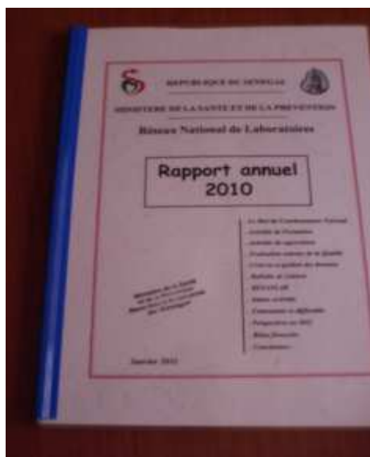
Rapport annuel 2010 du RNL