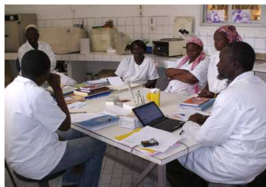
Feed back à chaud avec l'ensemble du personnel du laboratoire